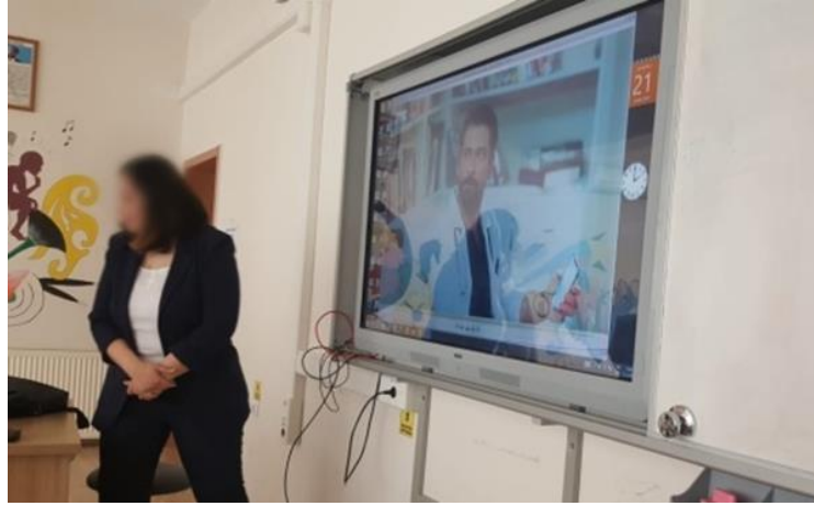
Şekil 5. Filmlerin analizi.