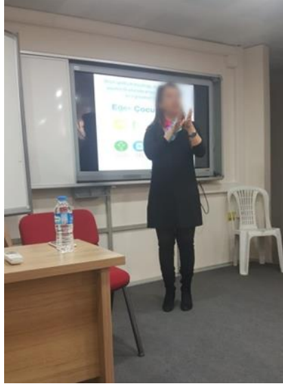
Şekil 2. Uzman psikolog.