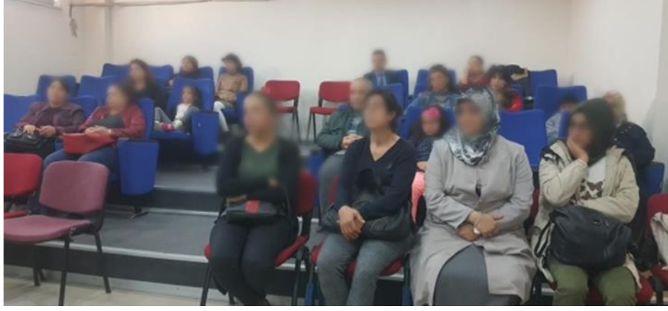
Şekil 1. Belirlenen 20 veli.

Araştırmamızın ikinci aşamasında ise; toplumumuzun otizm kavramına bakışı, otizm farkındalığı ve otizmlili çocuğı olan ailelerin yaşadıkları problemleri algılama düzeyleri ve değerler eğitiminin bu konudaki rolü ile ilgili farkındalık düzeyini tespit etmek amacıyla anket uygulaması yapılmıştır. Öncelikle, projenin örneklemini oluşturmak amacıyla Mersin ilinin Tarsus ilçesinde, 8-14 yaş aralığındaki üstün zekâ veya yetenekli çocuğı olan velilere, çalışmaya katılım anketi düzenlenip Şekil 1’de görüldüğü gibi, 20 gönüllü veli belirlenmiştir.