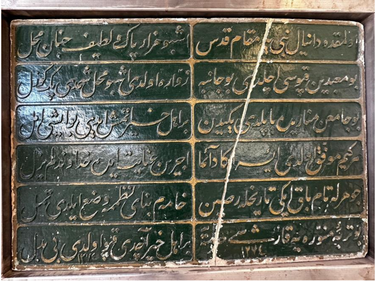
Şekil 10. Makam-ı Danyal Camii ve Hz. Danyal Peygamber Makamı Osmanlıca kitabesi.