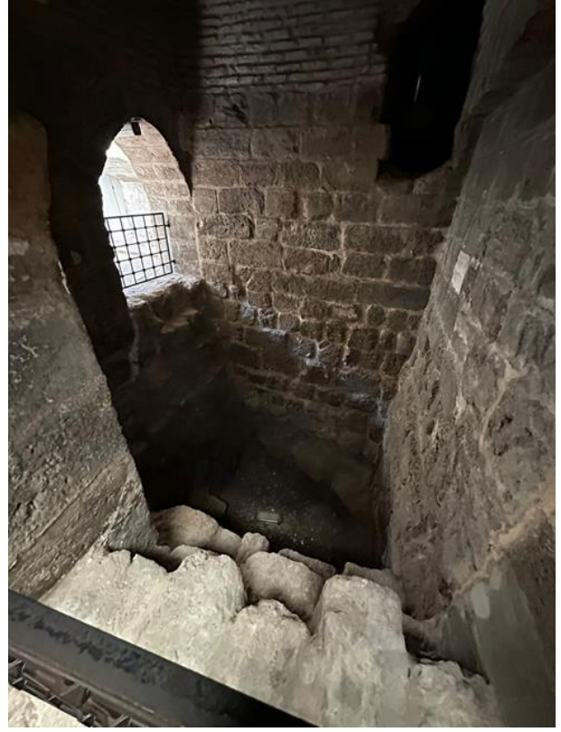
Şekil 8. Hz. Danyal Peygamber Makam bölümü.