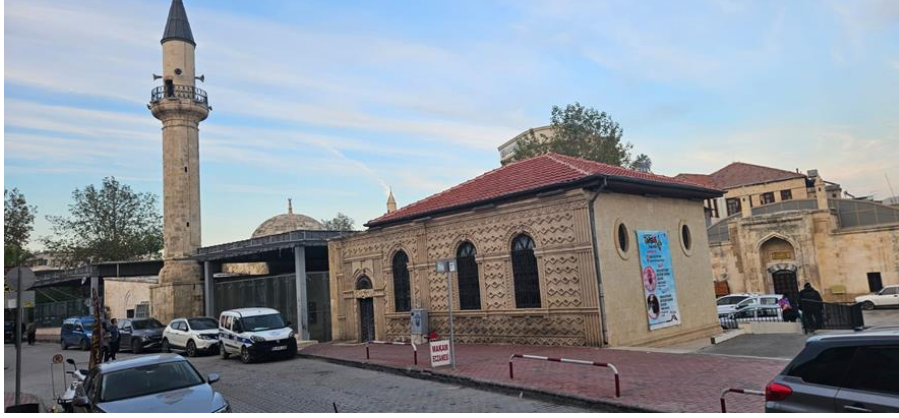
Şekil 1. Makam-ı Danyal Camii dış görünüşü.