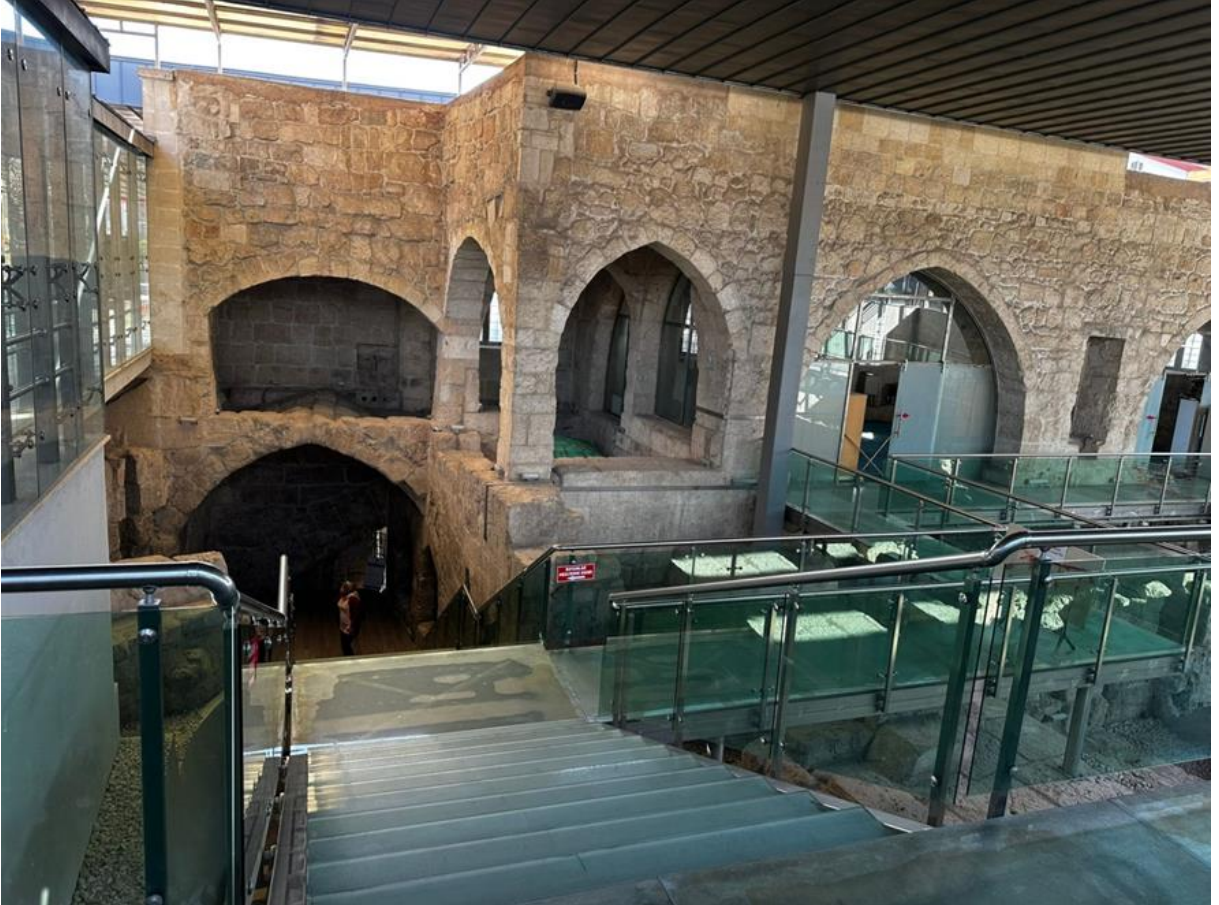
Şekil 6. Makam-ı Danyal Camii sağ yan iç görünüş.