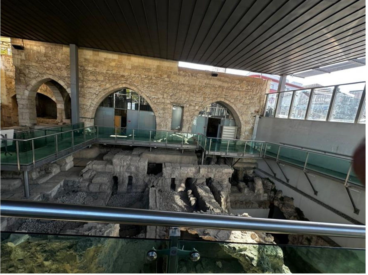
Şekil 5. Makam-ı Danyal Camii sol yan iç görünüş.