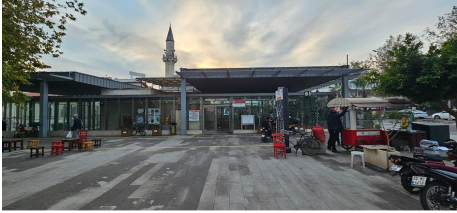
Şekil 2. Makam-ı Danyal Camii giriş kapısı dış görünüşü.