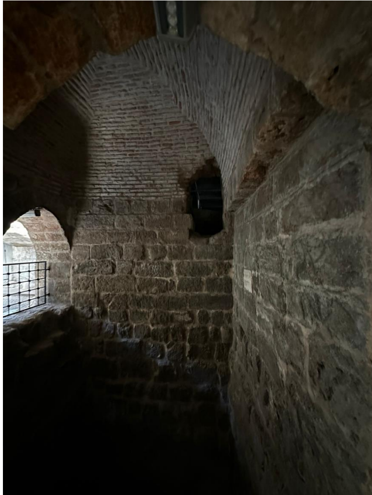
Şekil 9. Hz. Danyal Peygamber Makam bölümü.