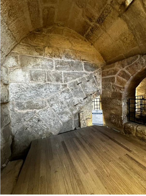
Şekil 7. Hz. Danyal Peygamber Makam bölümü.