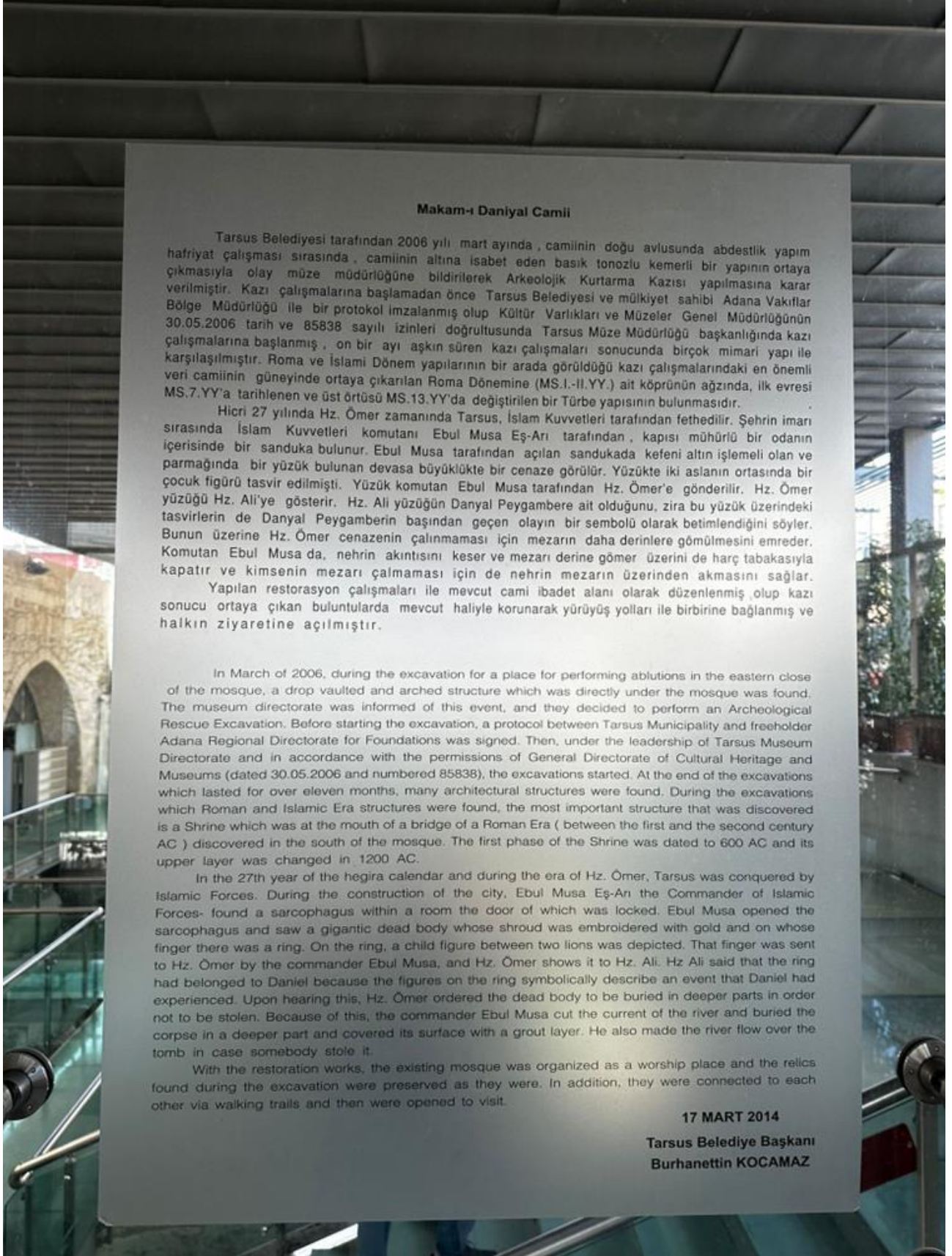
Şekil 13. Makam-ı Daniyal Camii girişindeki Tarsus Belediyesi tarafından hazırlanan Türkçe ve İngilizce açıklama.