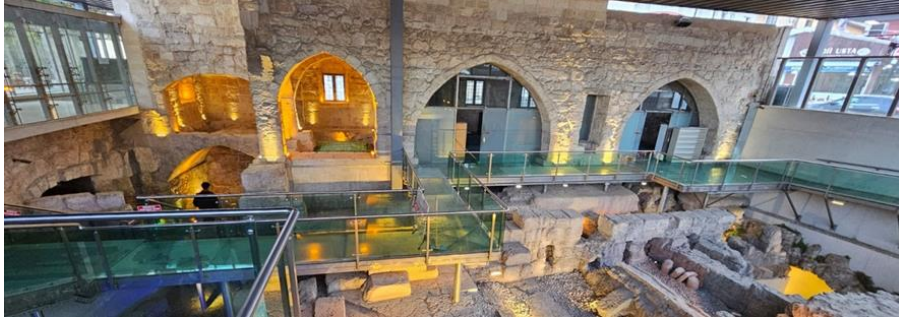
Şekil 3. Makam-ı Danyal Camii iç görünüşü.