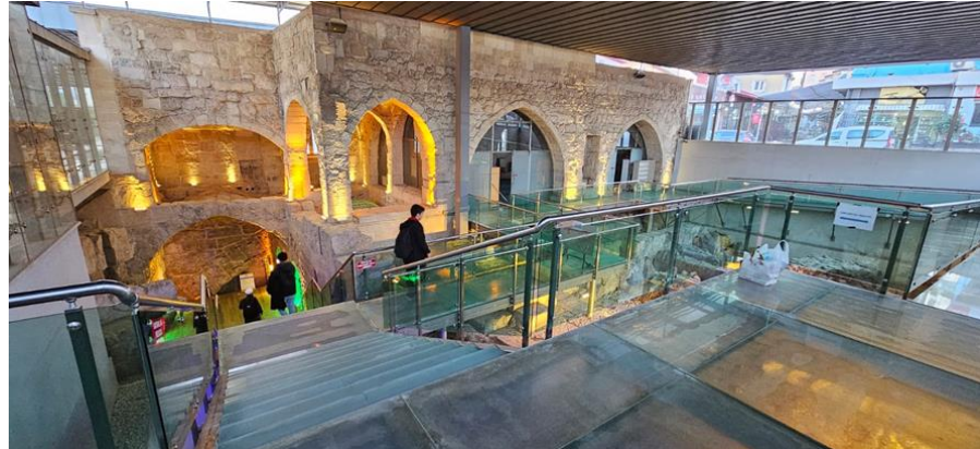
Şekil 4. Makam-ı Danyal Camii iç görünüşü.