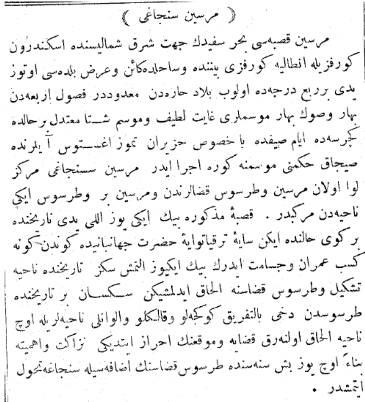
Şekil 1. 1900 Yılı AVS'de Mersin Sancağı Hakkında Verilen Malumat [15]

Mersin kasabasına iki saat mesafede evliyaların büyüklerinden Seyyid Âşık hazretleriyle büyük müelliflerden Tarsusî Ahmet Efendi 3 hazretlerinin mübarek kabirleri vardır. Murat Sofu hazretleri Elvanlı nahiyesi dâhilinde ve Mersin'e on saat mesafede bulunan Şahin Dağı üzerinde dört tarafı duvarla çevrili kabrinde ve Şeyh Bedir hazretleri kaza merkezi içinde medfundurlar [4].