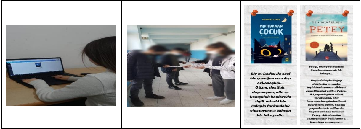
Resim 4. Okulda Kitap Ayraç Dağıtımı

6.Basamak: Deneysel çalışma bittikten sonra Arkadaşlık Aktivite Ölçeği ve Kitap Değerlendirme Formundaki görüşlerin analizi yapıldı.