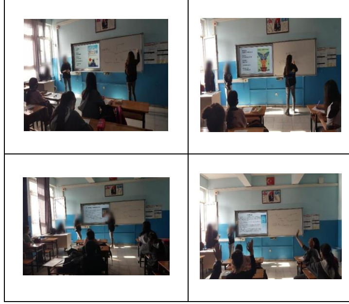
Resim 3. Kitap Okuma Atölyesi

5.Basamak: Kitap okuma atölyesinde, çalışma grubundaki öğrenciler tarafından kitap değerlendirme formunda belirtilen alıntılar arasından en beğenilenlerden seçilen alıntılarla kitap ayraçları tasarlandı ve okulumuzdaki öğrencilerin bu kitaplara olan ilgisini çekmek ve farkındalık yaratmak amacıyla okulumuzdaki öğrencilere bu ayraçların dağıtımı yapıldı (Resim 4).