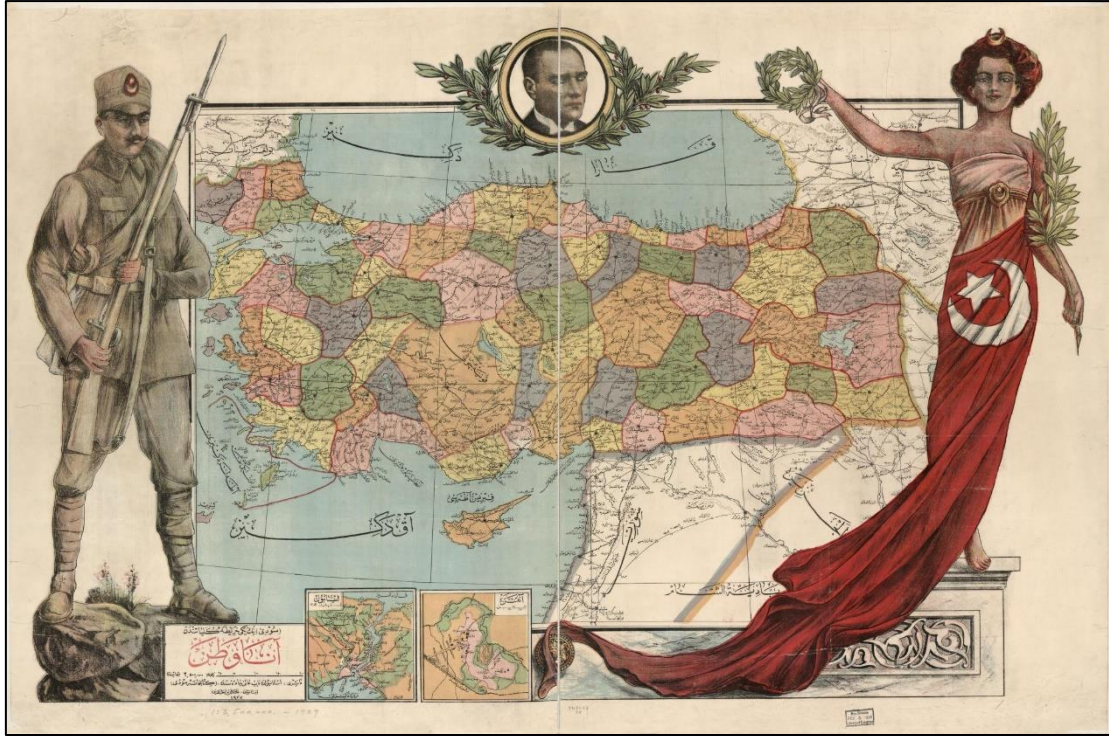
Resim-1 , 1927 tarihli Anavatan Haritası

Bu suretle oluşturulan vilayetlerden birçoğunun olması gereken niteliği taşımadığı kısa sürede anlaşılacaktır. 1926'da Dâhiliye Vekâleti tarafından İcra Vekilleri Heyetine (Bakanlar Kuruluna) sunulan rapor 1 doğrultusunda çıkarılan 877 sayılı Kanunla on bir vilayet lağvedilir [2]. Bu kapsamda kaza (ilçe) yapılan Üsküdar, Beyoğlu, Çatalca, Gelibolu, Genç, Ergani, Siverek, Kozan, Muş, Ardahan ve Dersim'in hangi vilayetlere bağlanacağı hususu Dâhiliye Vekâletinin takdirine bırakılır.