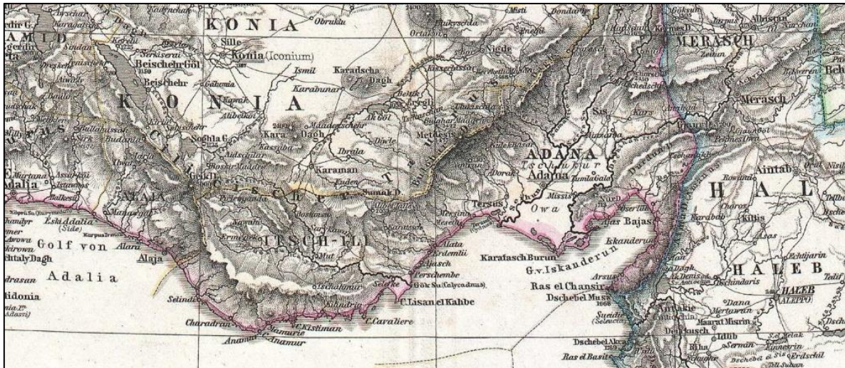
Resim-6, Stieler'in 1873 Türkiye haritasında İç-ili (Itsch-ili) ve Çukurova (Tschukur Owa) bölgesi

Yavuz Sultan Selim tarafından 1516'da Osmanlı topraklarına katılan Çukurova bölgesinde kurulan eyalete önceleri Vilayet-i Çukurobad denmiş, daha sonra ismi Vilayet-i Adana olmuştur. 1530 yılı defter kaydına göre Vilâyet-i Adana veya Vilâyet-i Çukurâbâd'ın, Adana, Tarsus, Üzeyr (Özer-ili) ve Sis olmak üzere dört sancağı bulunmaktadır [46]. Osmanlı'da eyaletlerin kaldırılıp vilayet sistemine geçildiği 1864'te Halep Eyaletine bağlı olan Adana 1869'da vilayet yapılmıştır.