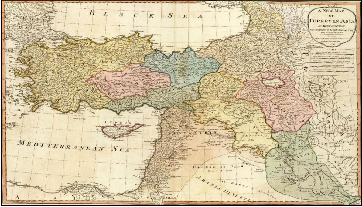
Resim-3, Anville'nin 1794 tarihli Türkiye haritası

Hatay bölgesinin Türkleşmesinde önemli rol oynamış ve uzun dönem hüküm sürmüş bir Türkmen aşiretinin reisi Özer Bey'den dolayı, bir zamanlar Dörtöl-İskenderun yöresine Özer Bey'in veya Özeroğulları'nın yurdu anlamında Özer-ili" ismi kullanılmıştır [22].