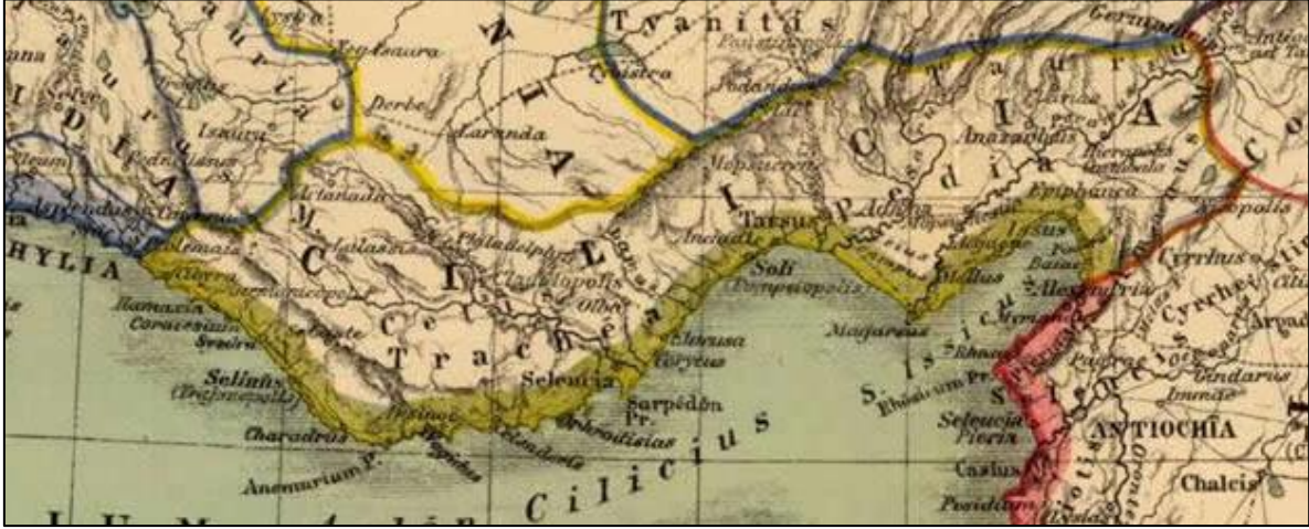
Resim-5, Antik Çağda Kilikya Bölgesi, kaynak:nereye.com.tr

Kilikya bölgesindeki Ermeni üstünlüğüne 1375'te Memlükler son verir. Memlükler'in Ermenilere karşı kazandığı zaferde, 1243'teki Köseadağ bozgunu sonrasında başlayan Moğol istilası nedeniyle Anadolu'dan Suriye'nin kuzeyine göçen Üçok ve Bozok koluna mensup Türkmenler aktif rol oynamıştır. Türkmen Boyları, Memlükler'in fethettikleri yerlere sahip çıkar ve buraları yurt edinirler. Türkmen Beyleri tarafından idare edilmeye başlanan bölge tamamen Türkleşir. Bozok Türkmenleri Maraş Bölgesinde Dulkadiroğlu Beyliğini, Üçok Türkmenleri de Çukurova Bölgesinde Ramazanoğulları Beyliğini kurar [44].